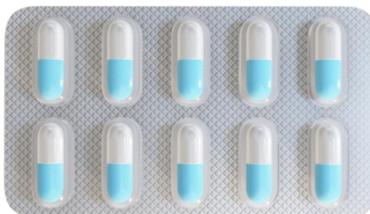
Рисунок 1. Название рисунка